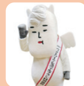
白馬村キャラクター ヴィクトワール・ジュヴァル プラン・村男三世