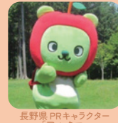
長野県PRキャラクター「アルクマ」