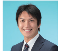
丸山 俊郎 白馬村長